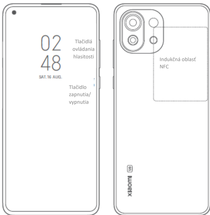
Port USB typu C